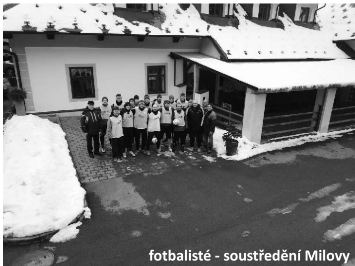
fotbalisté - soustředění Milovy

Zimní soustředění - pátku 26.1. - neděle 28.1.2018