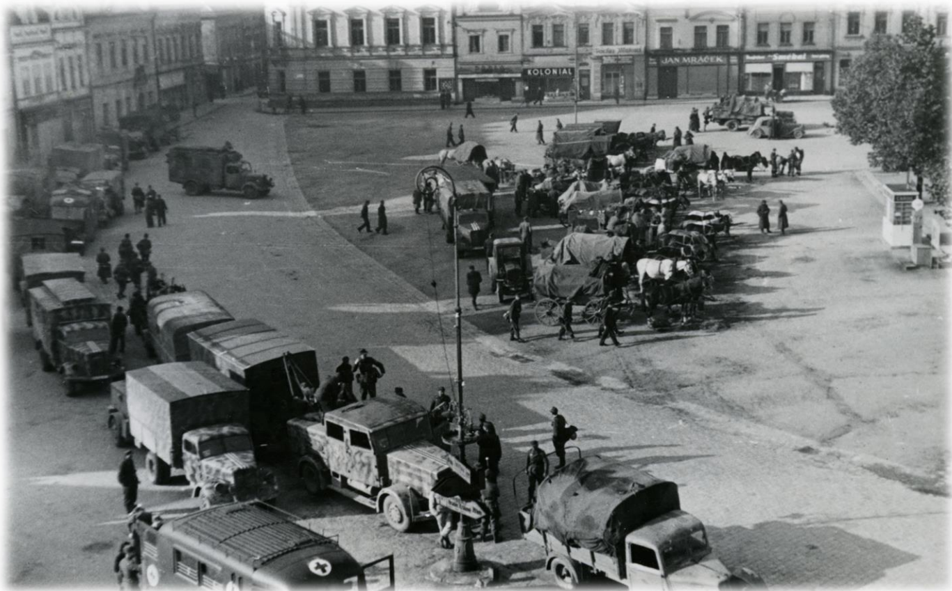
Sovětská vojska na náměstí ve Vysoké Mýtle – 9. a 10. května 1945