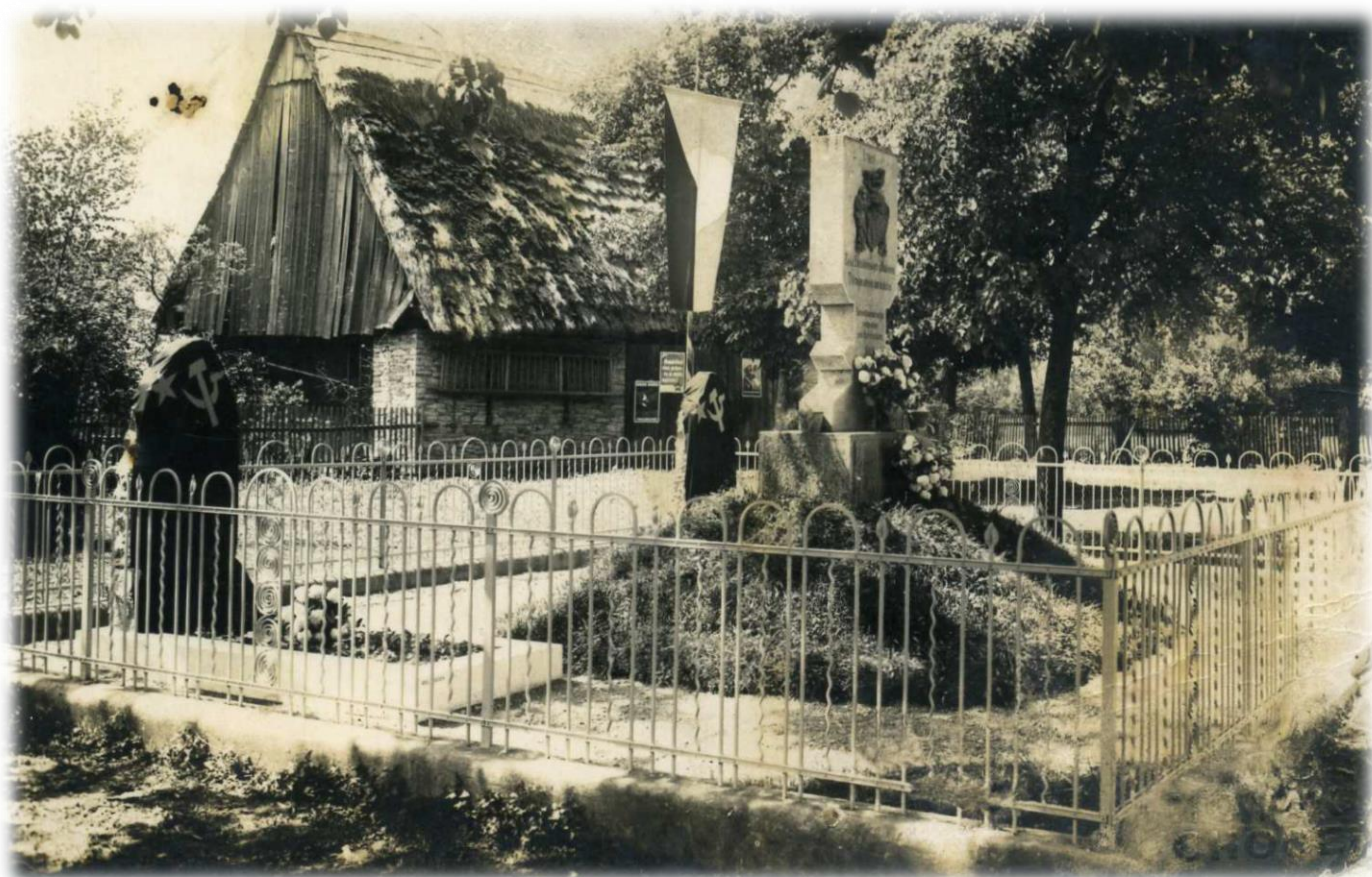
Hrob rudoarmějců u pomníku Dobříkovských z Malejova (dobová fotografie)