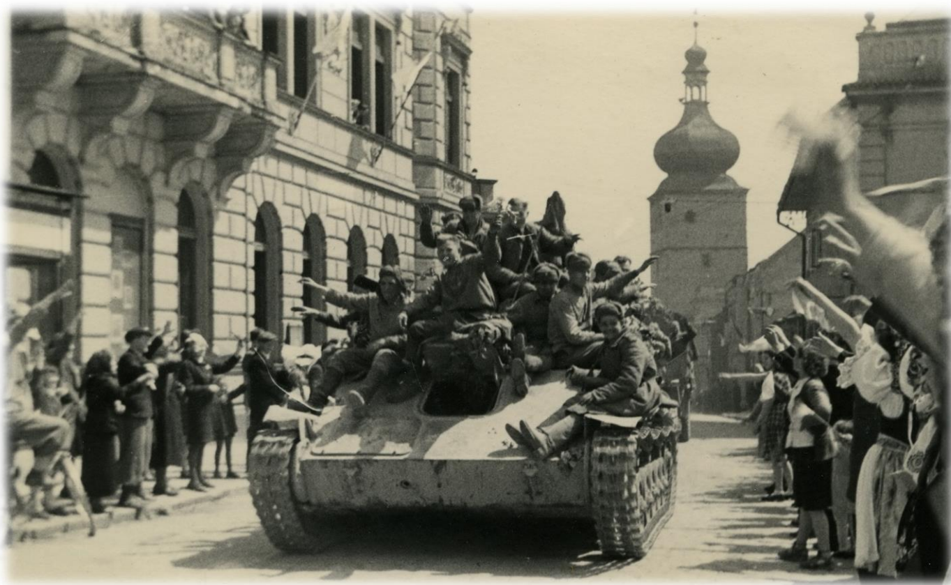
Dobová fotografie z Vysokého Mýta – Sovětský tank ve Vysokém Mýtě 9. května 15:45