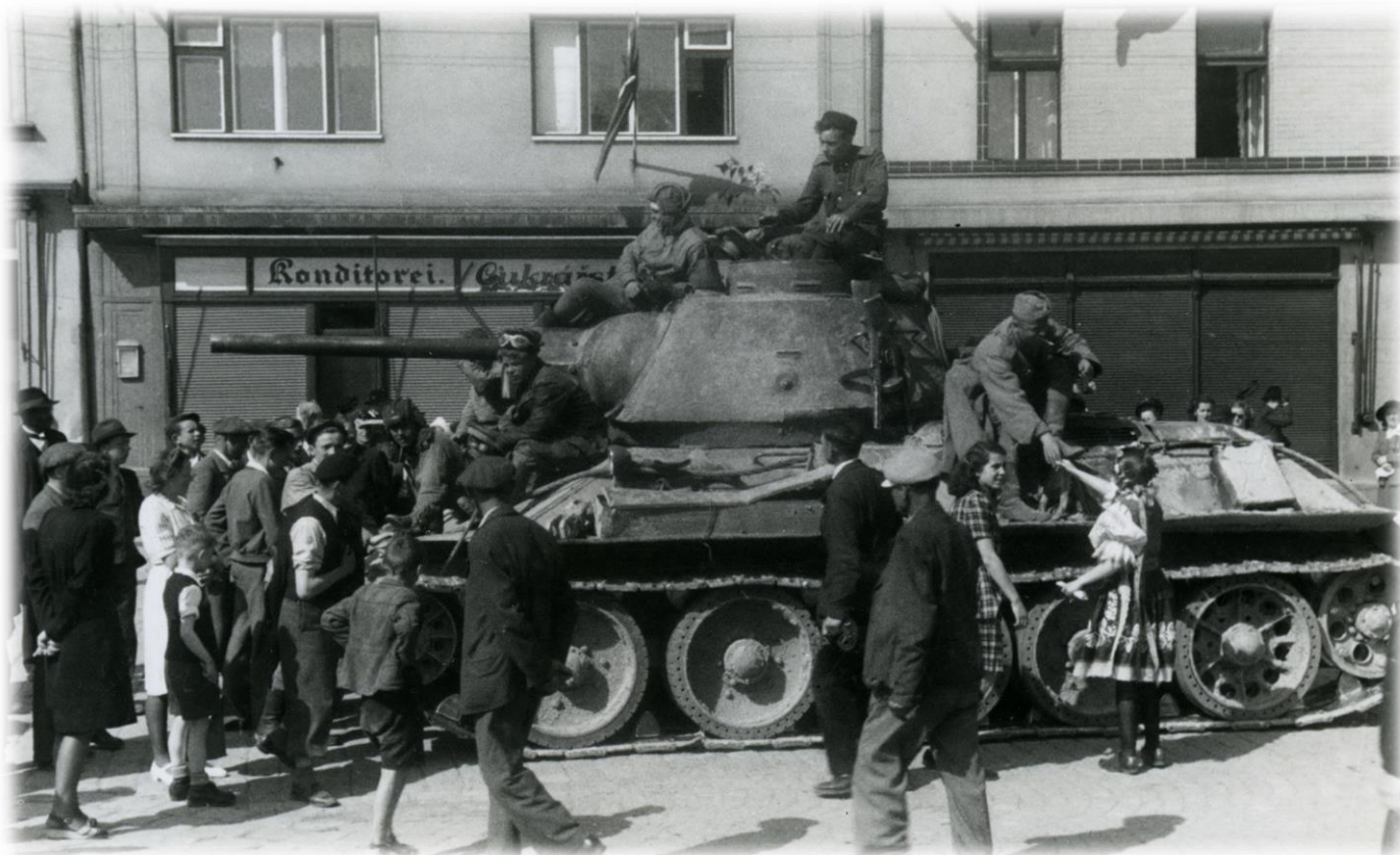
Uvítání sovětských vojáků ve Vysokém Mýtle 9. května 1945