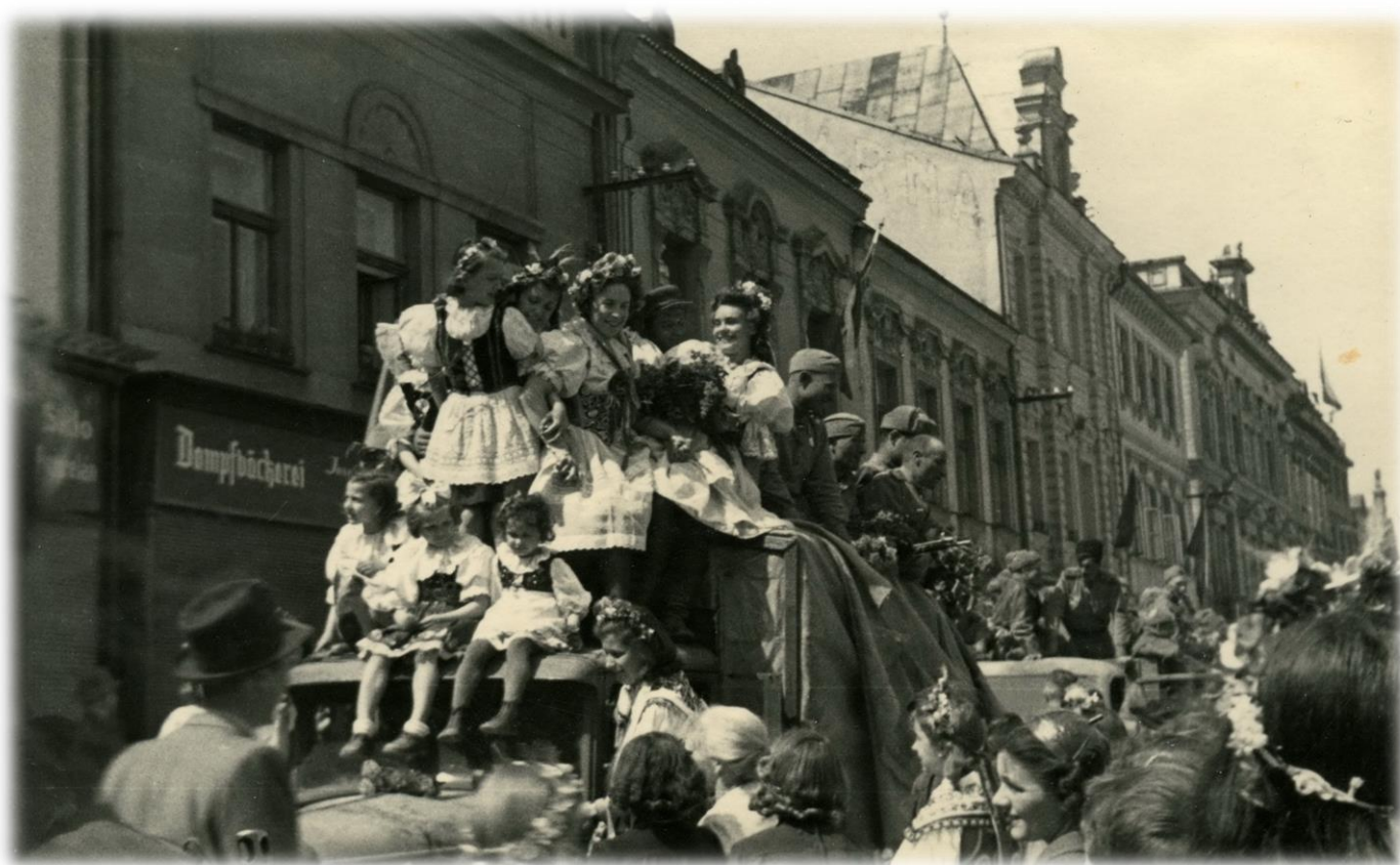
Uvítání sovětských vojáků ve Vysokém Mýtě 9. května 1945