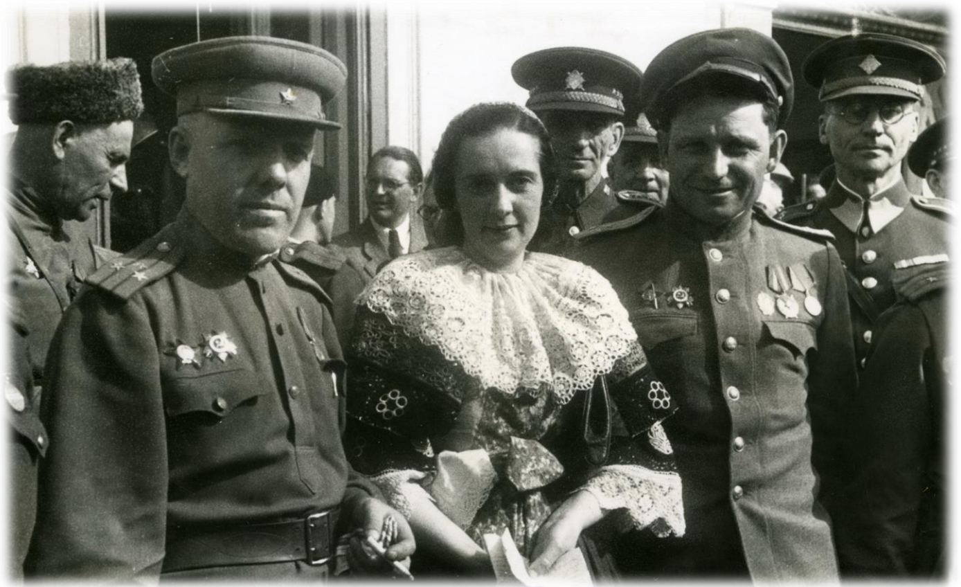
Sovětsí důstojníci ve Vysokém Mýtě