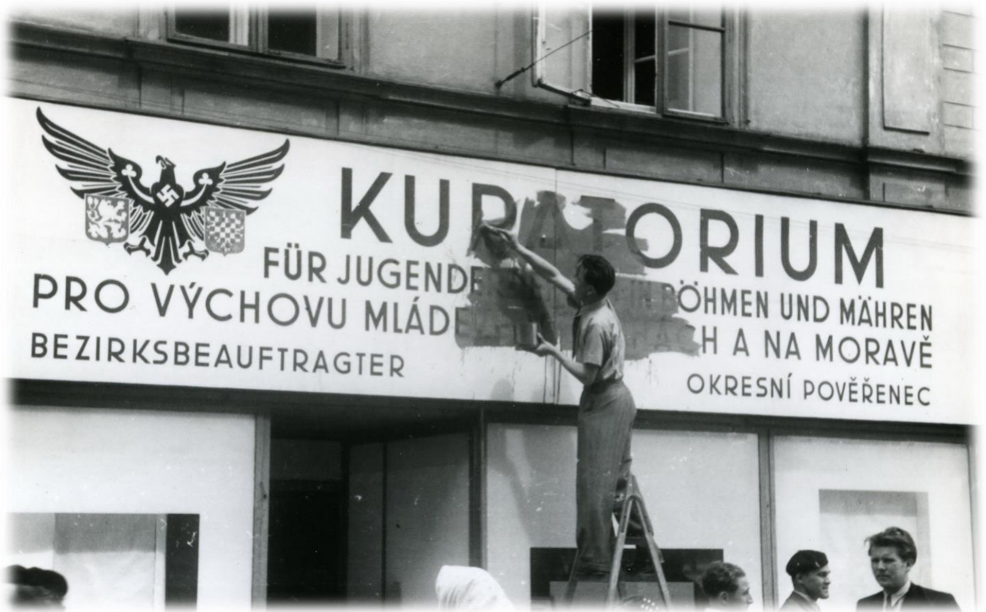
9. května 1945 byly odstraňovány německé nápisy ve Vysokém Mýtě