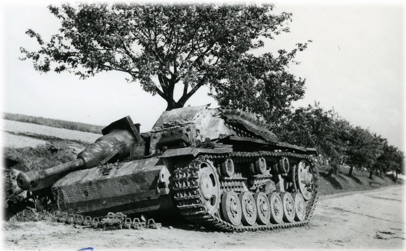
Zničený německý tank na cestě k Vraclavi