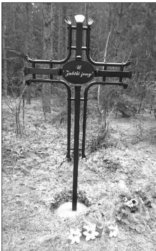
Kříž U Zabité ženy