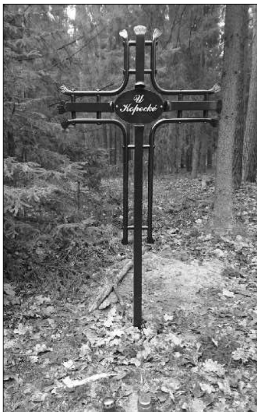
Kříž U Kopecké